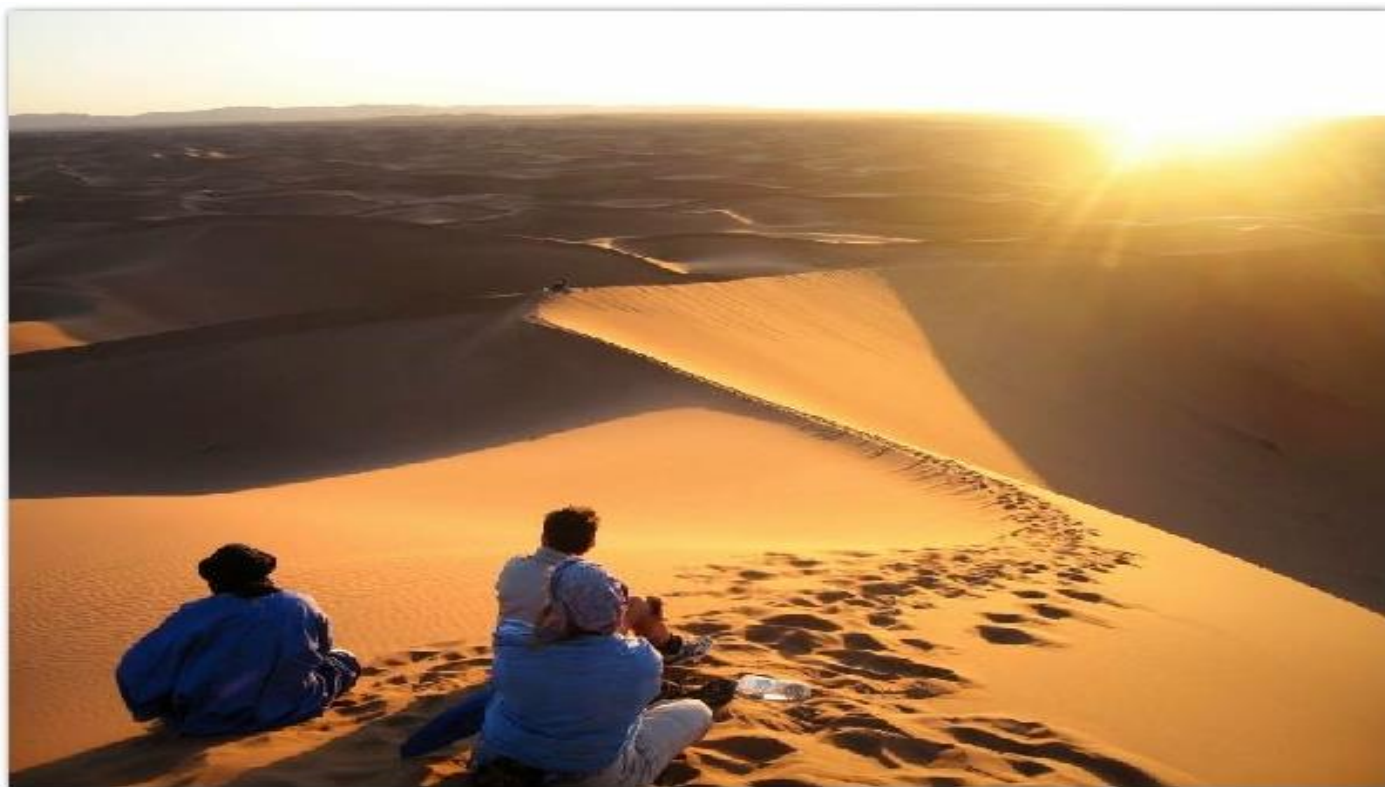
ATARDECER EN MERZOUGA

Desayuno incluido. Salida hacia el sur del país, pasando por el Medio Atlas, donde nos encontraremos la increíble ciudad de Ifrane, conocida como “la Suiza de Marruecos”. También pasaremos por Azrou, importante centro de artesanía del país. Parada en Midelt. Almuerzo incluido. Continuación por el valle de Ziz, donde se encontraba la antigua legendaria ciudad de Sijilmasa, que fue una importante escala caravanera en las rutas que conectaban el Mediterráneo con el centro de África, atravesando el desierto del Sahara. Llegada a Erfoud, cambio de vehículo para salir en coches 4x4 hacia el desierto (Merzouga), visitando las dunas para contemplar al atardecer y pasear en camello. Regreso al hotel Cena incluida y alojamiento en el Kasbah hotel Xaluca Arfoud ( 4*).