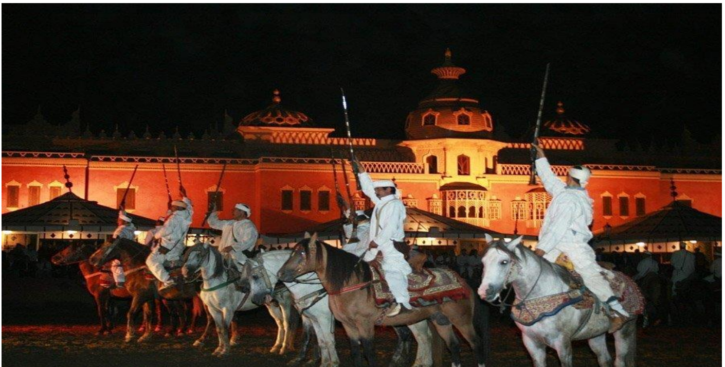
CENA ESPECTÁCULO EN CHEZ ALI

Desayuno incluido y salida a Marrakech a través del elevado paso de Tichka Pass con una altitud de 2260m llegaremos a la Kasbah de Aït Benhaddou la más famosa de Marruecos. Actualmente es Patrimonio de la Humanidad por la UNESCO. Almuerzo incluido . Continuación a Marrakech . Llegada, cena incluida en el Chez Ali y alojamiento en Hotel Adam Park & Spa (5*) .