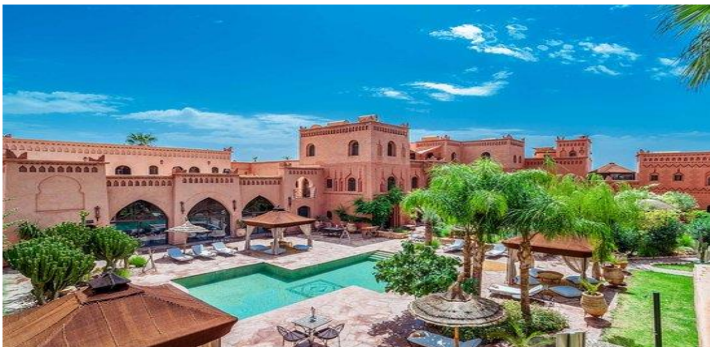
HOTEL KSAR IGHNDA. OUARZAZATE.