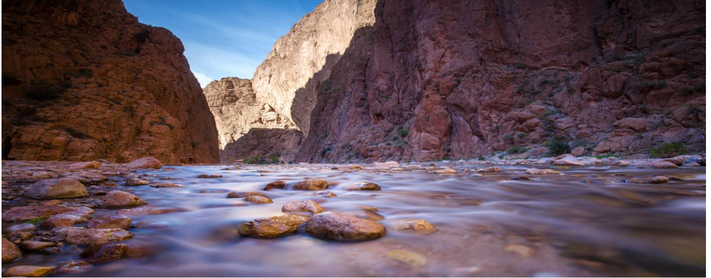
GARGANTAS DEL TODRA

un pasado esplendor. Tour de orientación con visita a la Kasbah Taourirt (entrada incluida) . Llegada al Riad Kasbah Ksar Ighnda , cena incluida y alojamiento.